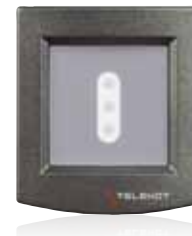
Moderne cryplock- Zutrittskontrollleser aus dem Hause TELENOT sichern den Zugang der Firma Betzold.